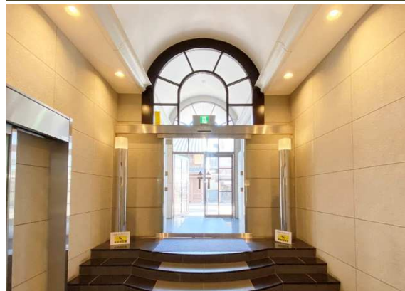
吹き抜けのあるエントランスホール