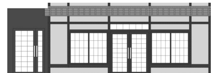
変更後の1階立面図