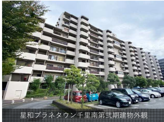
星和プラネタウン千里南第3期建物外観

緑に抱かれた大阪屈指の住宅街「千里丘」生活施設が徒歩圏内で充実したマンション生活がお約束できます。