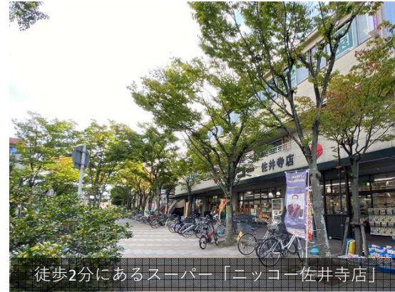
徒歩2分にあるスーパー「ニコニコ佐井寺店」

●アルコープ式玄関で視線を遮りプライバシーを確保●玄関に靴箱を設置●トイレのウォシュレット・風呂・洗面台・洋室クローゼットは2020年に新調●広々5.0畳のキッチン●9.2帖の広々和室。座卓を置くと戸建て感覚の和室の居間としてご利用できます。●7.6畳の和室は板間付きで一間半の押入。昔ながらの和室の寝室として利用できます●食堂・居間天井高2,700cm●一階東向きで庭付き陽当り良好●庭の面積18.4㎡・テラス面積7.76㎡合計面積26.16㎡(約8坪)の庭はご自由に利用でき家庭菜園も可能●小学校(東佐井小学校徒歩約4分)・中学校(佐井寺中学校徒歩約4分)も徒歩圏内●スーパーニコニコ佐井寺店は徒歩約2分