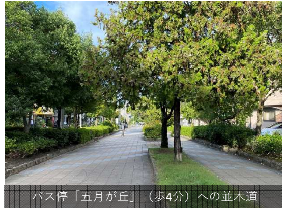
バス停「五月が丘」(歩4分)への並木道