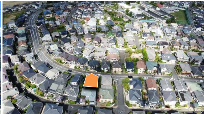
周辺の街並み（東側）