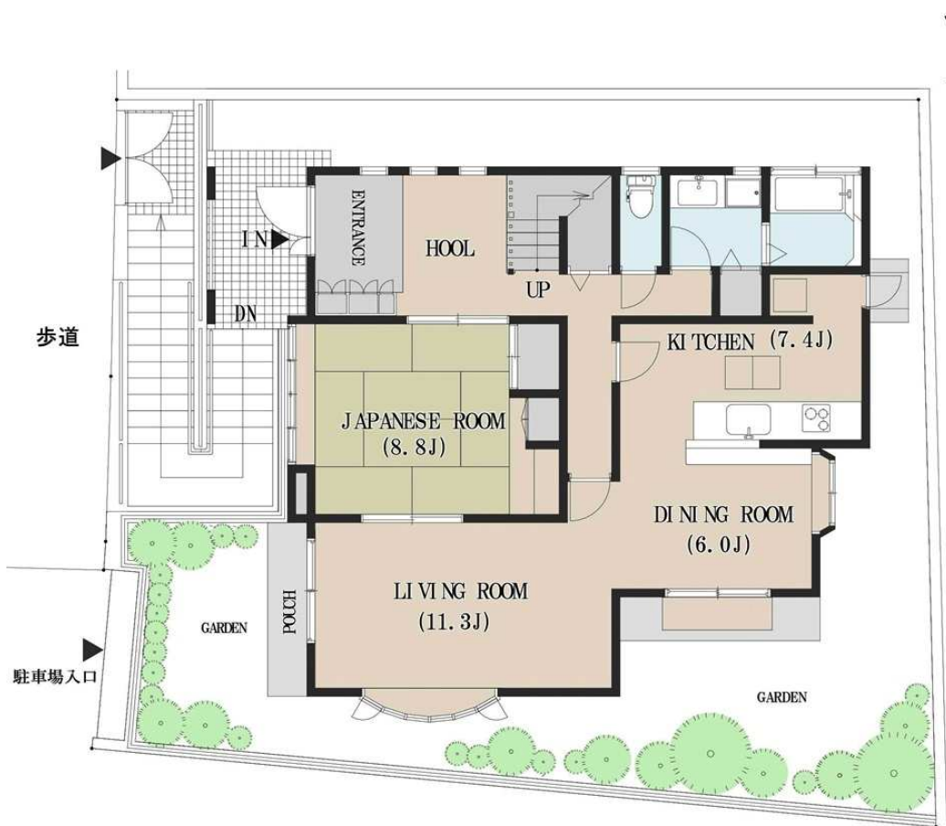
一階平面図 床面積：85.74㎡