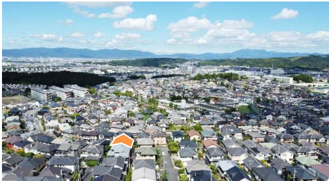
周辺の街並み（西側）