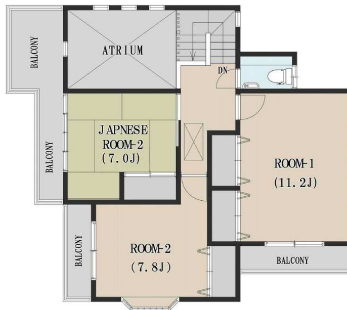
二階平面図 床面積：60.61㎡