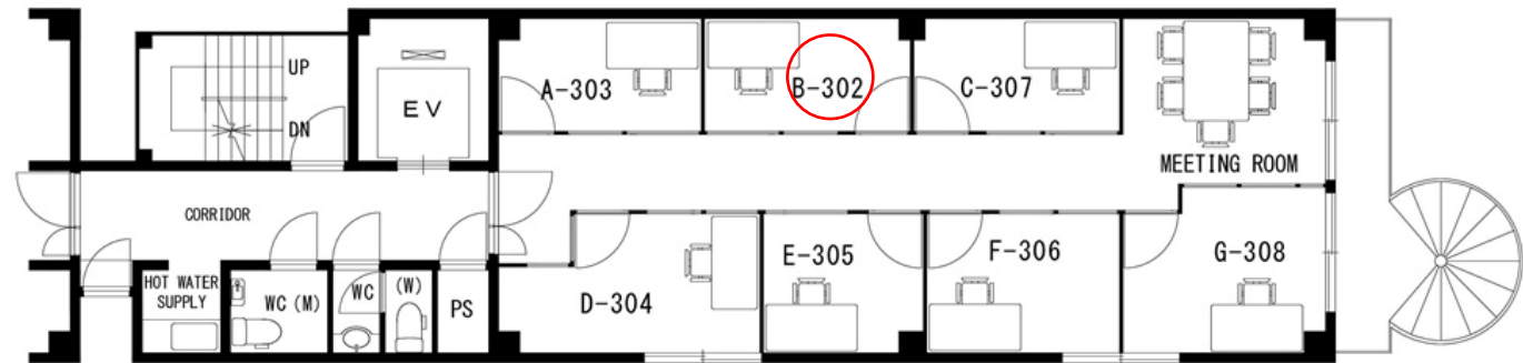
綾小路パレス3階平面図